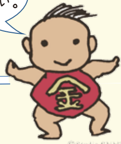
小金井市イメージキャラクター-こきんちゃん